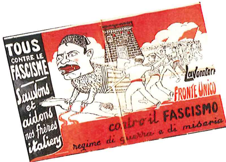
© Tous contre le fascisme! Sauvons et aidons nos frères italiens! 19 novembre 1932 Imprimé Archives départementales des Alpes-Maritime