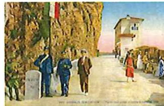
© Vintimille, le pont Saint-Louis à la frontière italienne, Carte postale années 1920