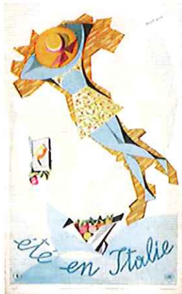
©Été en Italie Mino Delle Site 1952 Chambre de Commerce et d'Industrie Marseille Provence, QAF04527