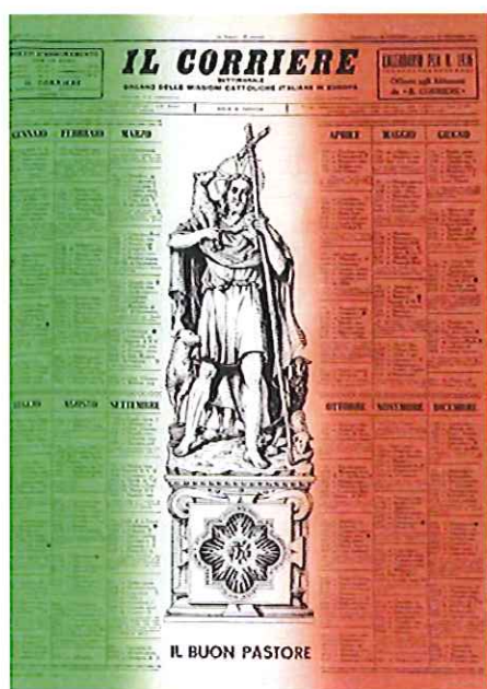
©Il Corriere Journal de la mission catholique italienne en Europe 1935 Centre d'information et d'études sur les migrations